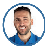
DIAGRAMMA DECISIONALE E PROGNOSI DEL DENTE TRATTATO ENDO CON DENTE COMPROMESSO - FABIO PICCOTTI