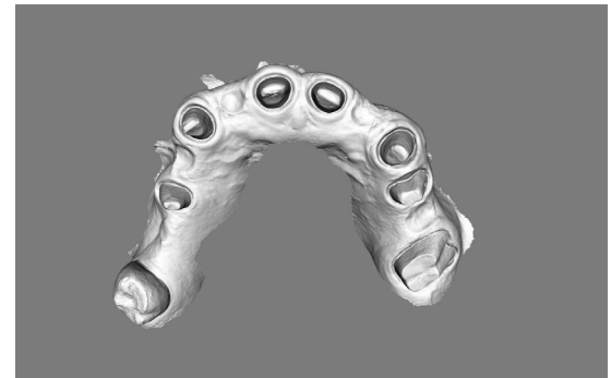
Impronte Analogiche e Digitali