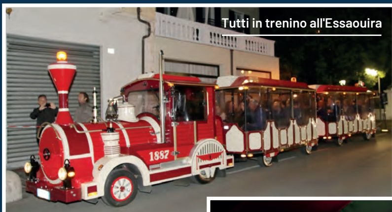
Tutti in trenino all'Essaouira

Fondatore del Campionato Mondiale di Pesto al Mortaio, eseguirà una dimostrazione del tradizionale pesto genovese utilizzando il suo storico mortaio. A seguire, si terrà una degustazione di pesto durante l'aperitivo. Inoltre, verrà offerta una prepagata omaggio del valore di 10€ utilizzabile sulla piattaforma e-commerce Palatifini.it e nei negozi Rossi 1947.